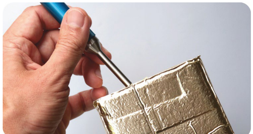
ABBILDUNG 5: Leckage mit der Schnüffelsonde orten.

Hier kommt als Methode das weltweit erprobte und angesehene Lecksuchverfahren im Vakuum zum Tragen. Dieses Verfahren ist zerstörungsfrei, temperaturunabhängig, eindeutig und durch die spezielle Folienkammertechnologie stressarm für die Verpackung. Normalerweise würden im Vakuum die Nähte aufplatzen können. Während des Evakuierungsvorganges drückt der Atmosphärendruck die elastischen Folien an die Verpackung. Der Innendruck der Verpackung entspricht nun dem At-