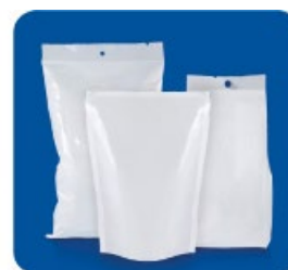
Gegen Luft und Keime: verschiedene flexible Umverpackungen für Lebensmittel und Medikamente.

sich meist wie ein Labyrinth über einen Bereich von 5 und 15 mm entlang. Deshalb gilt auch die primäre Prüfung den Siegelnähten. Die Leckage an den Siegelnähten wird auch Laminarleckage bezeichnet.