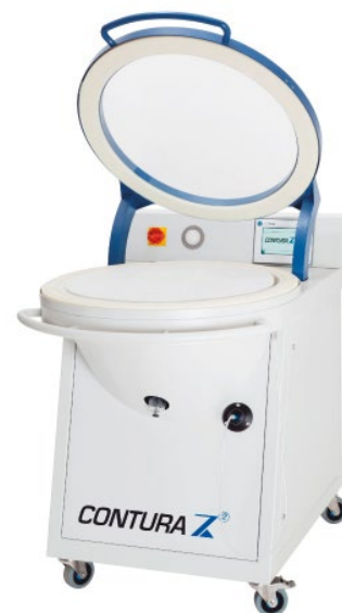
ABBILDUNG 3: Prüfkammer

Gerade bei Hinterschnitten oder durch Siegelnähte entstehenden Falten ist der Gasaustritt und damit die visuelle Detektion weiters deutlich erschwert. Dies gilt dann meist auch für die automatisierten Systeme. Damit stellt die o.g. Grenzleckrate auch wirklich für die